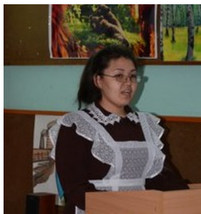
Фото с семинара педагогов