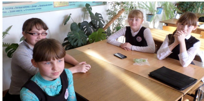
Команда «ЭРОН» 5 «Б» класса