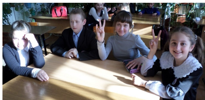
Команда «Лесники» 5 «Б» класса