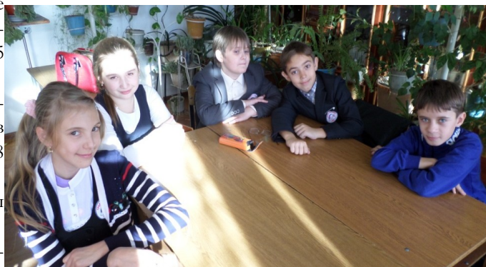
Команда «Защитники леса» 5 «А» класса