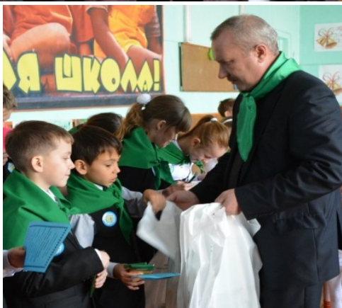
Фото с семинара педагогов

Все силы и знания посвятить охране природы и восстановлению леса.